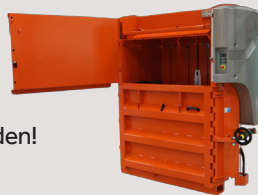
Pendeltür für extra niedrige Bauhöhe.